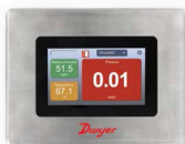
带不锈钢表圈面板的RSME